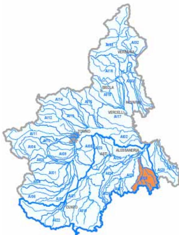
bacino idrografico del torrente Orba

Dal punto di vista amministrativo, bacino idrografico del torrente Orba ricade nelle territorio delle Regioni Piemonte e Liguria. Per quanto riguarda la regione Piemonte ricade interamente nella provincia di Alessandria e interessa 39 comuni, l'ATO 6, due ASL (20, 22), due Comunità Montane (Alta Val Lemme e Alto Ovadese e Suol dell'Eleramo comuni delle valli Orba, Erro e Bormida) e due Aree Omogenee (Novese e Ovadese).